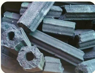
🔥 Arang kayu