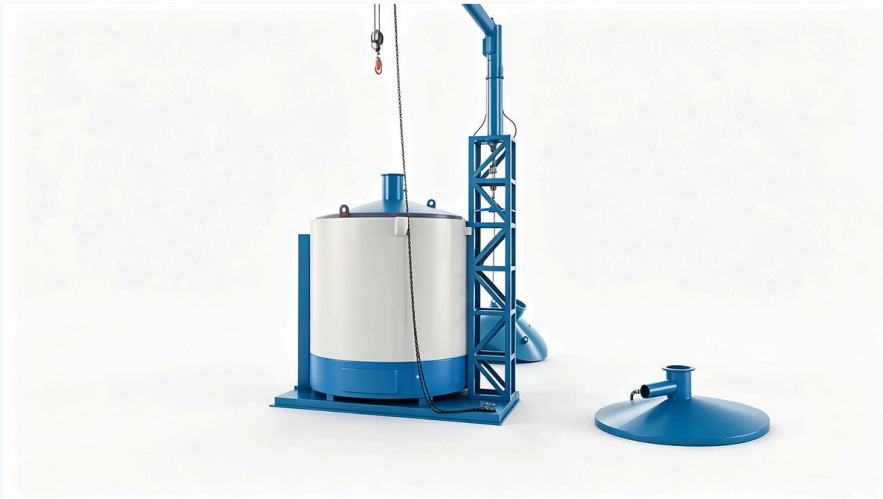
🌲 Lini karbonisasi lengkap – efisien & stabil