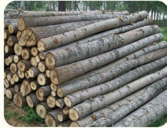
🌲 Kayu gelondongan