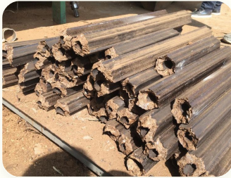
📦 Briket serbuk gergaji