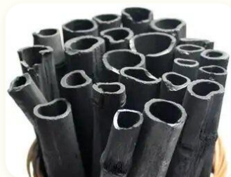
⚙️ Arang buatan