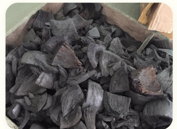
🥥 Arang tempurung kelapa

Karbon tetap tinggi · Kadar abu rendah · Ideal untuk BBQ, filtrasi industri, deodorisasi & amandemen tanah