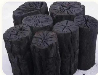
🌱 Arang bambu