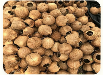
🥥 Tempurung kelapa