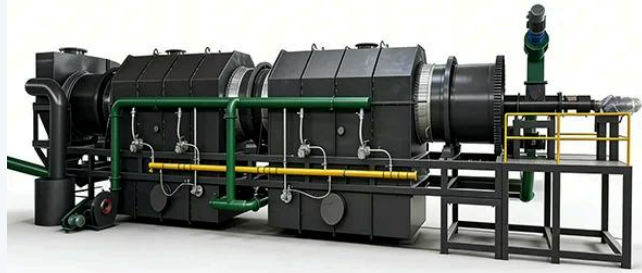
🌿 Lini karbonisasi lengkap – efisien & stabil