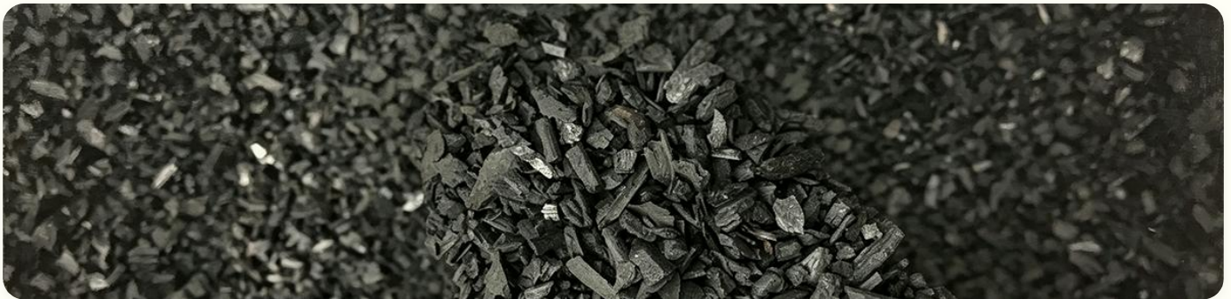
🔥 Arang BBQ