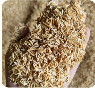
🌾 Sekam padi