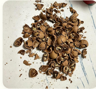
🍌 Kulit buah