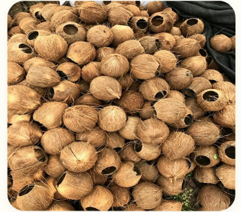
🥥 Tempurung kelapa