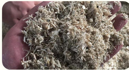
◆ Matéria-prima para pellets de biomassa