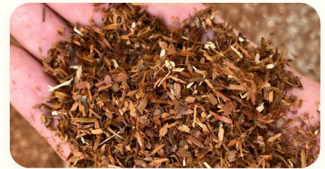
◆ Substrato para cogumelos