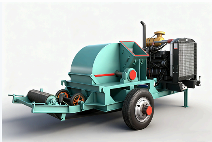
🌲 Triturador de madeira de disco móvel · Operação eficiente e estável