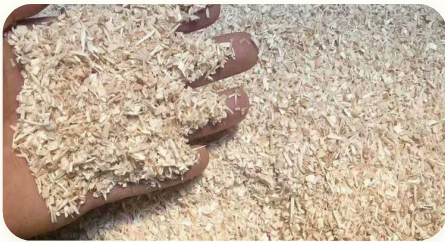
◆ Cavacos 1~20 mm