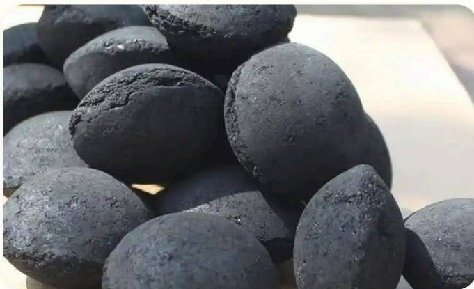
🔥 Combustible industrial