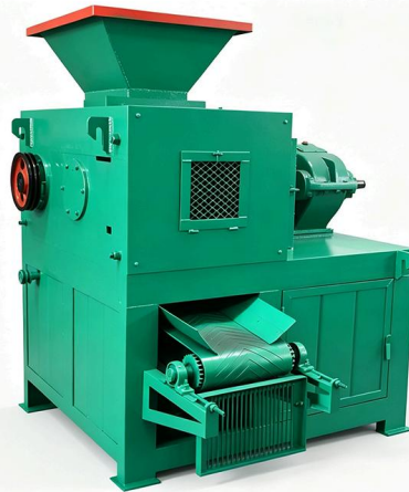
🌱 Línea de briquetado completa – eficiente y estable