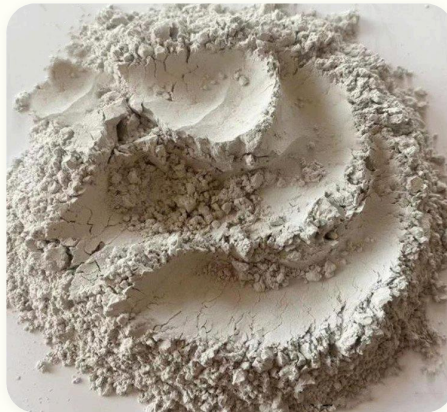
🔥 Polvo de carbón mineral