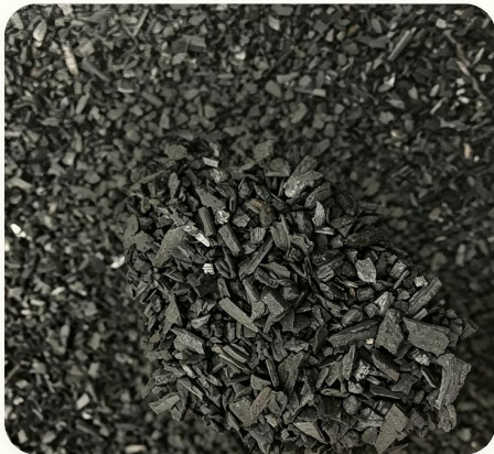
☒ Polvo de carbón vegetal