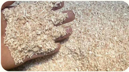
🔹 Serpihan kayu 1~20 mm