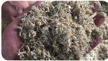
🔹 Bahan baku pelet biomassa