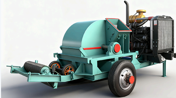
Penghancur Kayu Disc Bergerak · Operasi efisien &amp; stabil