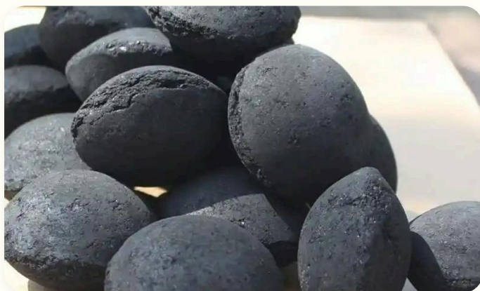
🔥 Bahan bakar industri