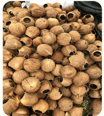
🥥 Tempurung kelapa