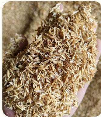
🌱 Potongan bambu