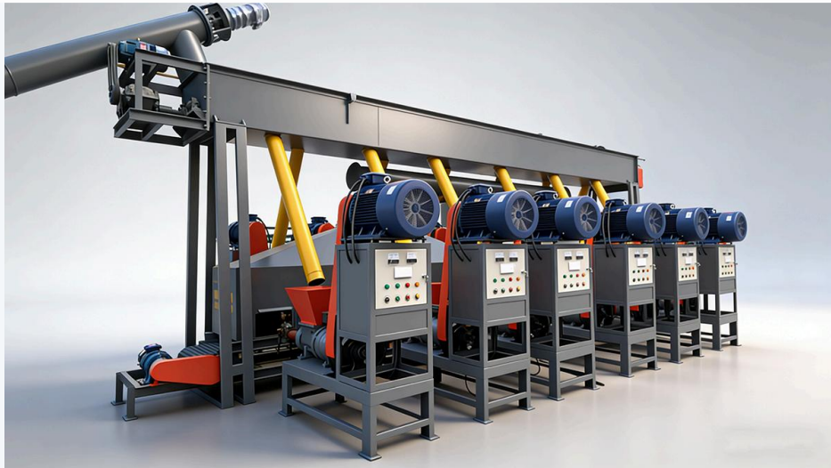
Ekstrusi spiral presisi – briket arang kepadatan tinggi untuk BBQ & penggunaan industri