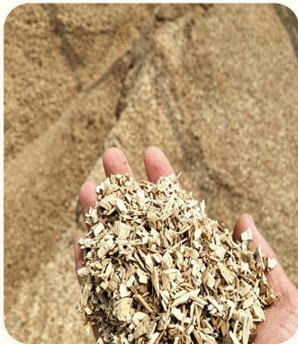
☒ Serpihan kayu