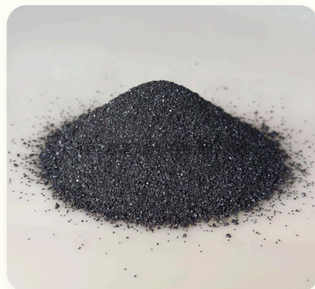
🏠 Bột khoáng sản