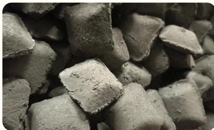
🏠 Tạo hình luyện kim