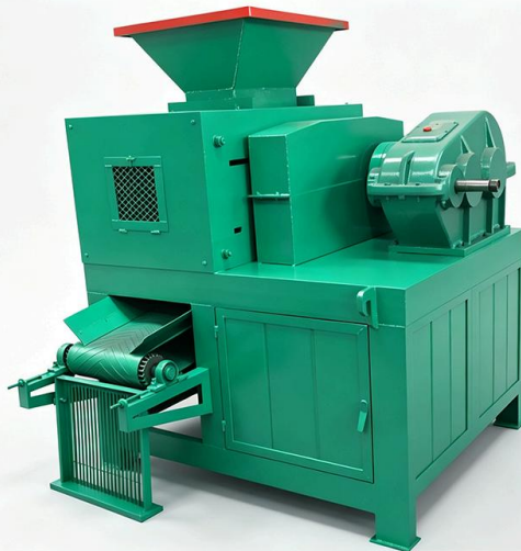
Ép bánh chính xác – bánh than hình cầu, vuông, dạng gói