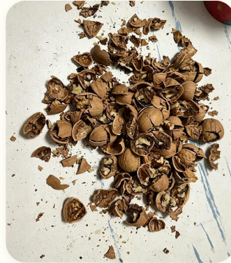
🌾 Palha de arroz