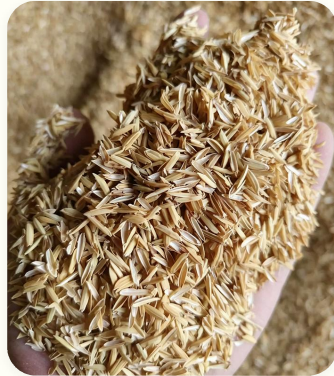
🌱 Restos de bambu