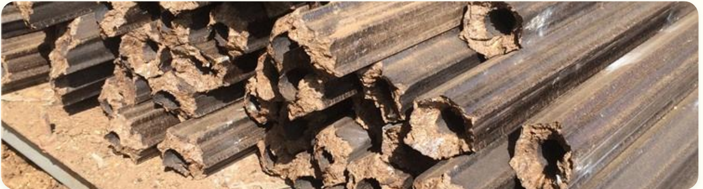
🔥 Briquetes de carvão para churrasco