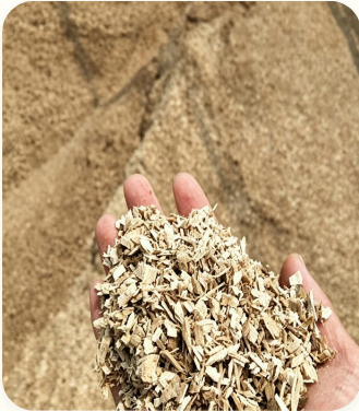
🗲 Cavacos de madeira