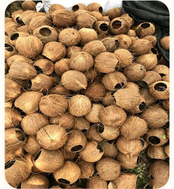
🥥 Cascas de coco

Teor de umidade: 8%–12% · Tamanho de alimentação \leq 5 mm