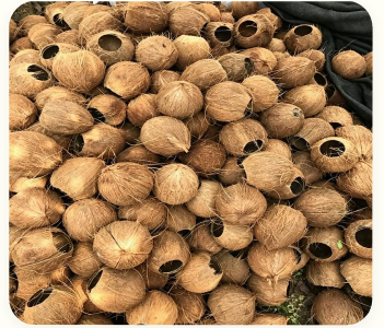
🥥 Cáscaras de coco

Humedad < 15% · Tamaño de alimentación < 10cm