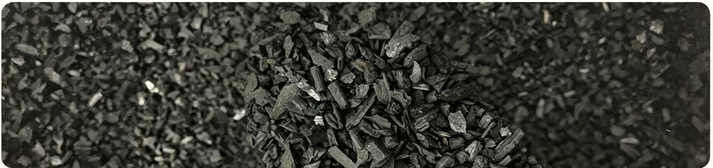
🔥 Carvão para churrasco