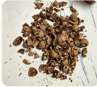
🥥 Cascas de frutas