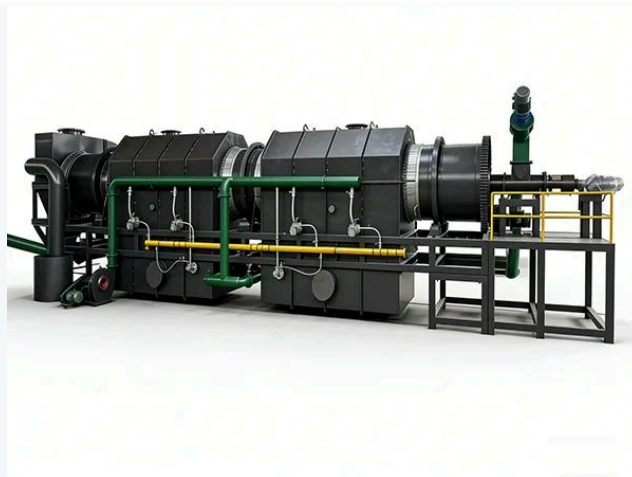
🌲 Linha de carbonização completa – eficiente e estável