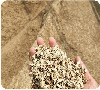
🌲 Lascas de madeira