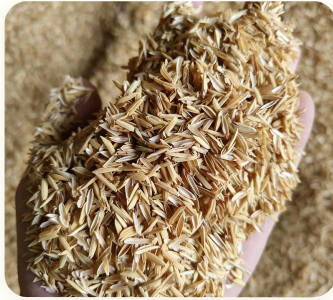
🌿 Cascas de arroz