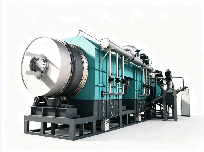
⚙️ Forno de carbonização contínua – operação ininterrupta 24/7