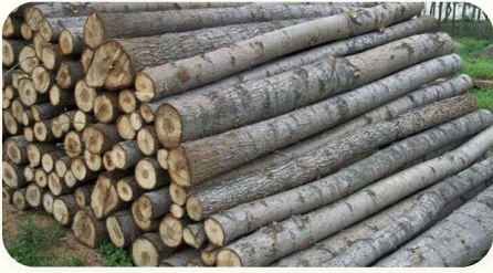
🌲 Troncs / branches