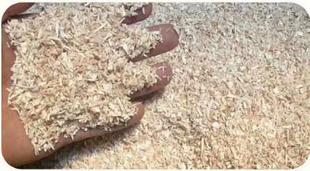
◆ Copeaux 1–20 mm